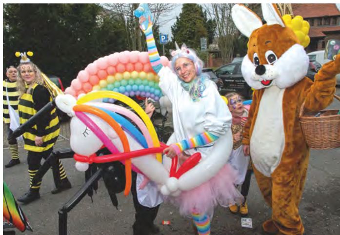
Die Gruppe „Nitsche und Ahlers Ballonkunst“ siegte bei der Zugprämierung zum Tulpensonntagszug.