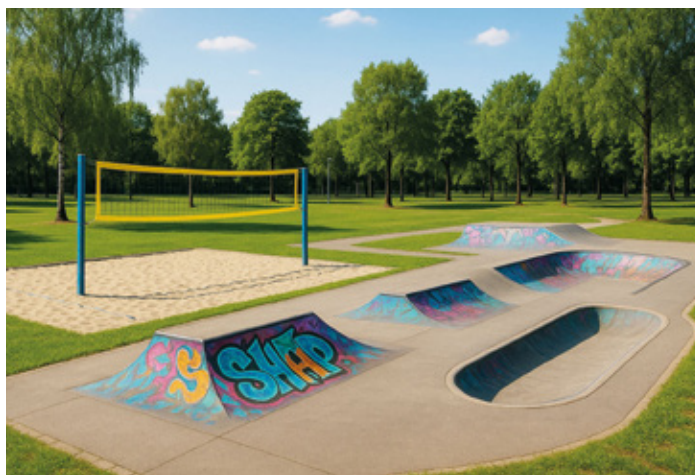
Animation neues Volleyballfeld.