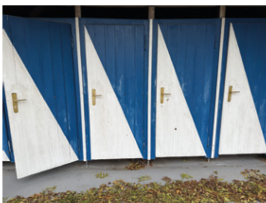
Alte Umkleiden.