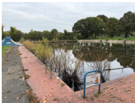
Altes Freibad.