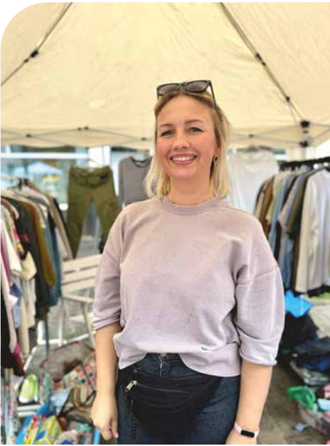
Am Christi Himmelfahrt lockt unter anderem der Trödelmarkt in den Hülser Ortskern.