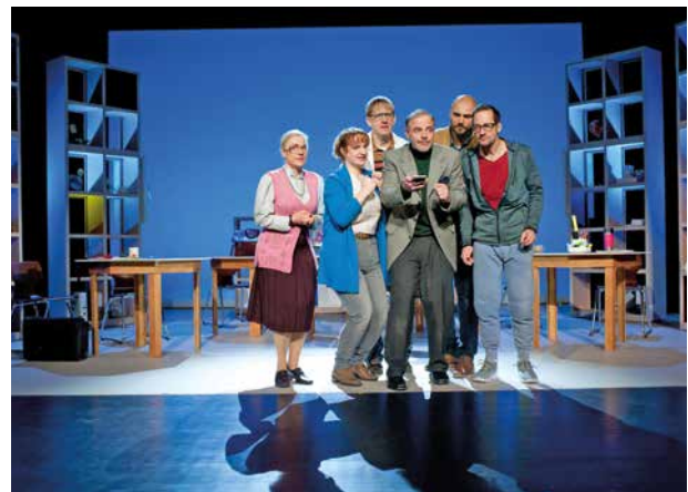
Die Komödie „Eingeschlossene Gesellschaft“ am 29. Mai um Forum.

Zwei Abende, zwei unterschiedliche Formate und doch ein gemeinsames Ziel: beste Unterhaltung im Forum Corneliusfeld. Der StadtKulturBund Tönisvorst präsentiert Ende Mai und Mitte Juni ein abwechslungsreiches Programm zwischen Theater und Comedy.