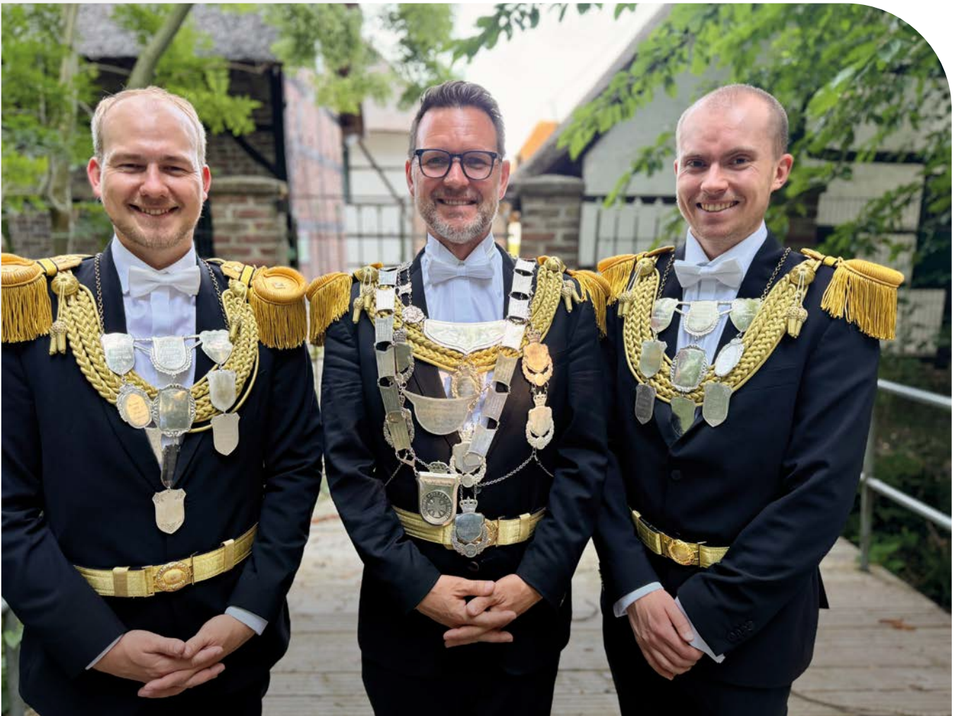
Minister Laurenz Türk, König Alexander Kättner und Minister Till Impelmans vor der Dorenburg.