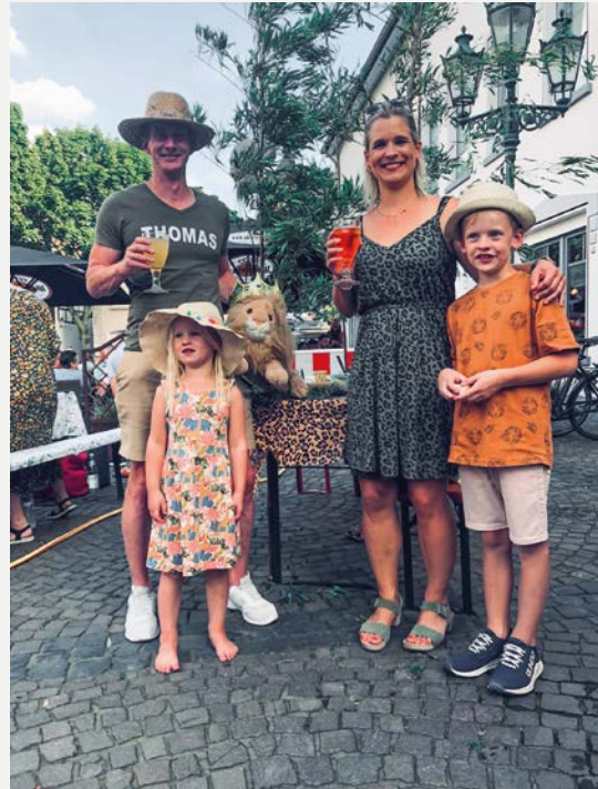
Thema Dschungel bei der Romantischen Sommernacht 2022.

Familien, Nachbarschaften, Freundeskreise und Vereine bringen Speisen und Getränke einfach selbst mit und verwandeln den Marktplatz in ein großes gemeinsames Picknick unter freiem Himmel. Wer keine eigene Sitzgelegenheit besitzt, kann gegen eine Gebühr von 15 Euro beim Verein Grefrath InTakt eine Bierzeltgarnitur reservieren. Die Teilnahme an der Veranstaltung selbst ist kostenlos. Lediglich für die musikalische Unterhaltung wird im Laufe des Abends mit dem Hut um eine freiwillige Spende gebeten.