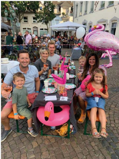
Thema Flamingo bei der Romantischen Sommernacht 2021.